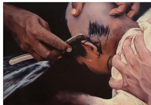
RITE, 40 X 55 CM, OLJE PÅ LERRET