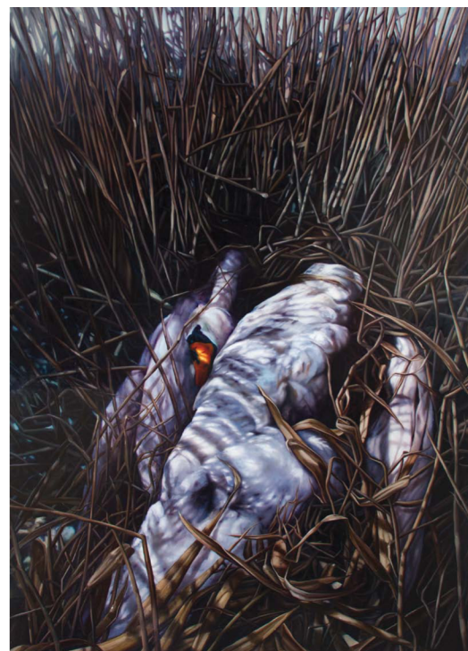
SWAN SONG, 200 X 140 CM, OLJE PÅ LERRET