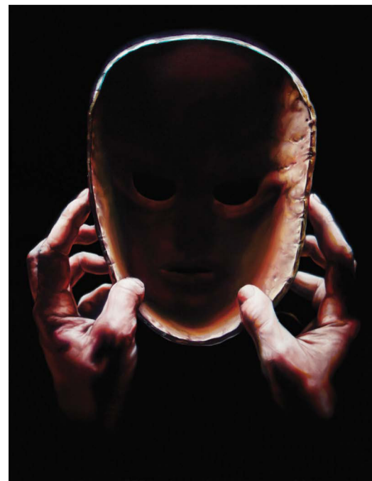
SKUESPILLERKUNSTNEREN, 40 X 30 CM, OLJE PÅ MARMOR